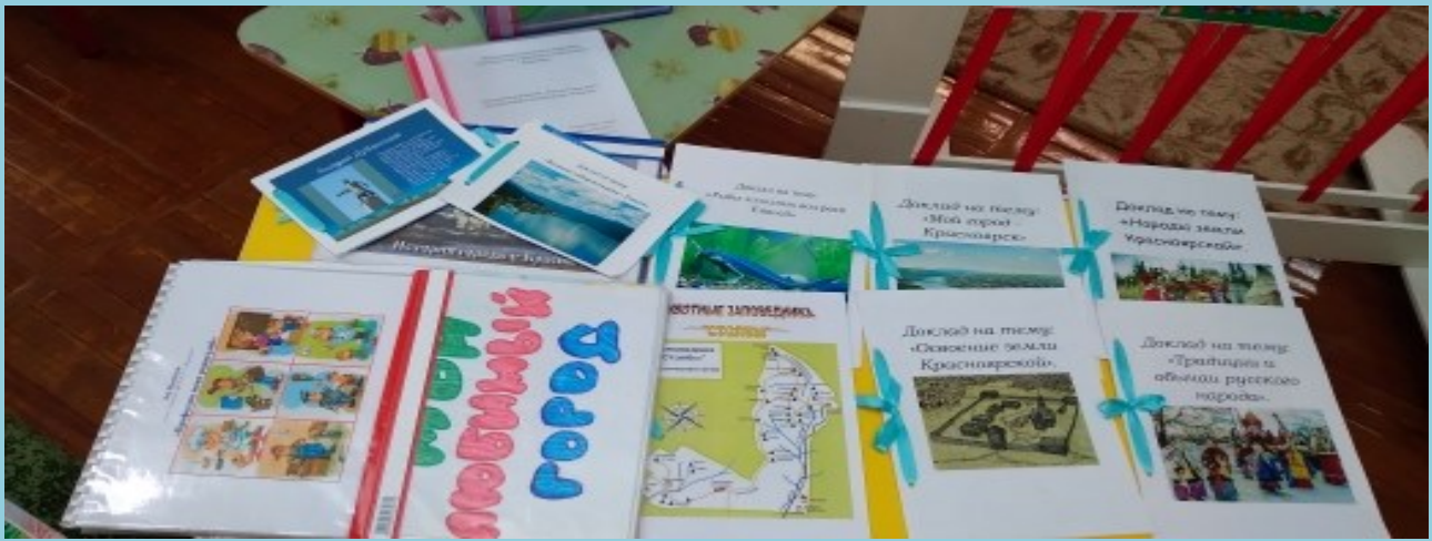
☞ Альбомы детских рисунков: «МОЙ ЛЮБИМЫЙ ГОРОД» (достопримечательности г. Красноярска);