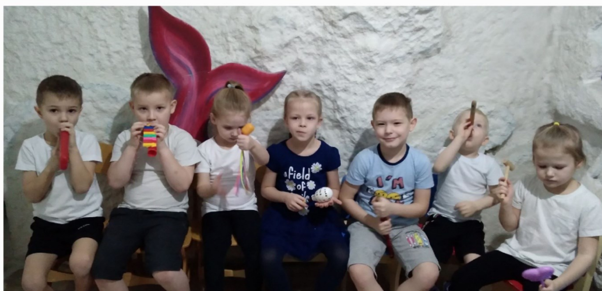
РАЗОМНЁМСЯ, ПЕСЕНКУ СПОЁМ